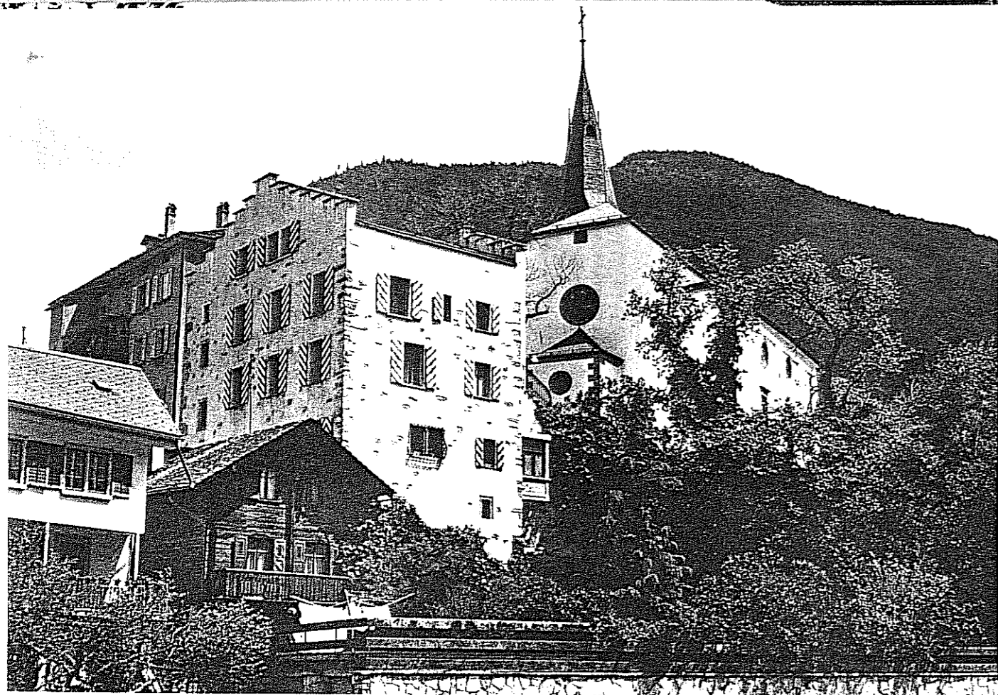
25 Il borgo di Visp