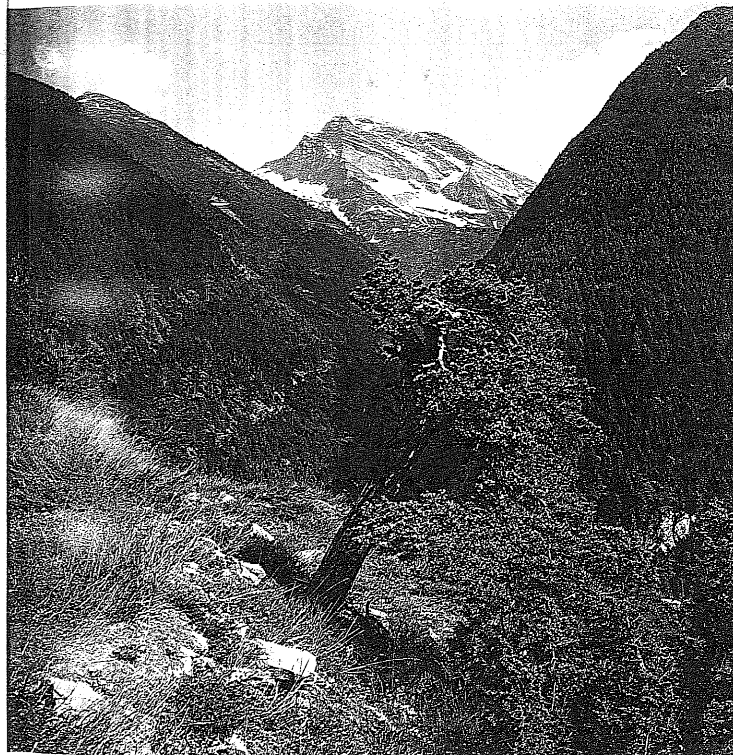
22. La val Taferna con la mulattiera e lo Hübschhorn

commercio — soltanto Lucerna appoggiava la politica di Silenen — troncò definitivamente la conseguente politica d'oltr'alpe dei vallesani. Nell'aprile 1487 scoppiò un nuovo conflitto armato, durante il quale i vallesani, aiutati da mercenari provenienti da diversi luoghi confederati, conquistarono Domodossola ed occuparono, sul monte Matarello presso Crèvola, eccellenti posizioni difensive. Come ad Arbedo, anche qui la voglia di saccheggiare era più forte della disciplina e della vigilanza, e quando i milanesi passarono al contrattacco massiccio, i contingenti rimasti erano troppo deboli per difendere con successo le posizioni, e si arrivò alla catastrofica sconfitta di Crèvola, seguita il 23 luglio dal patto di pace. Non fu però di lunga durata: continui cavilli e nuove controversie di confine mantenevano in allarme gli uomini a sud del Sempione. Nell'aprile 1494, i vallesani ripartirono in spedizione punitiva nella val Divedro, e gli italiani immediatamente resero pan per focaccia, subendo peraltro, vicino al «ponte alto» nella gola di Gondo, una pesante sconfitta. Dopo l'armistizio seguì il trattato di pace del 9 gennaio 1495 che sanzionò la definitiva rinuncia del vescovo di Sion e della provincia del Vallese a tutte le loro pretese a sud di Gondo. Il bilancio di queste