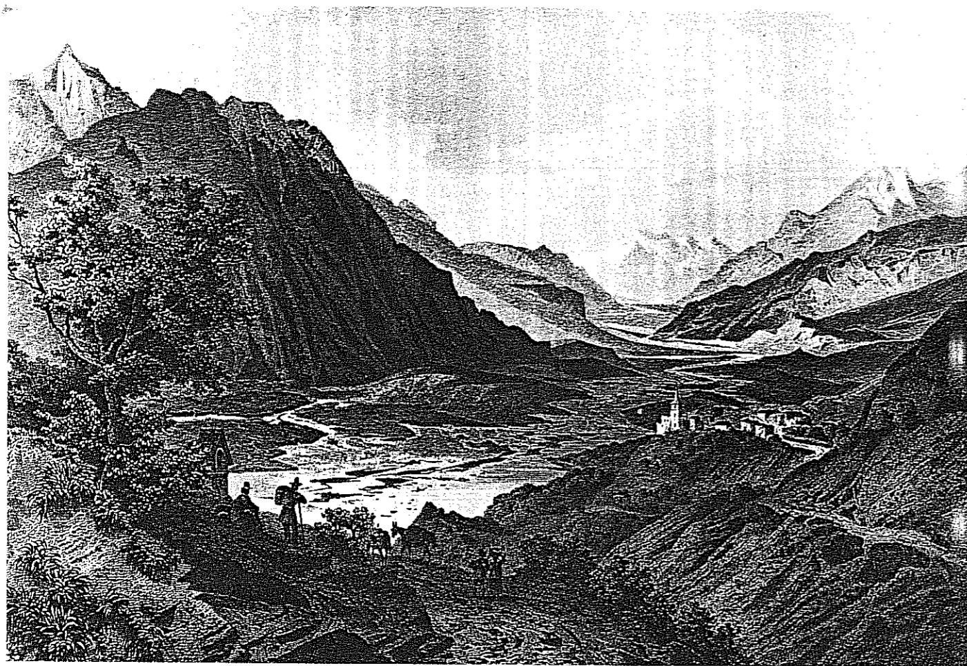
21. Varen e la valle del Rodano al tempo delle mulattiere