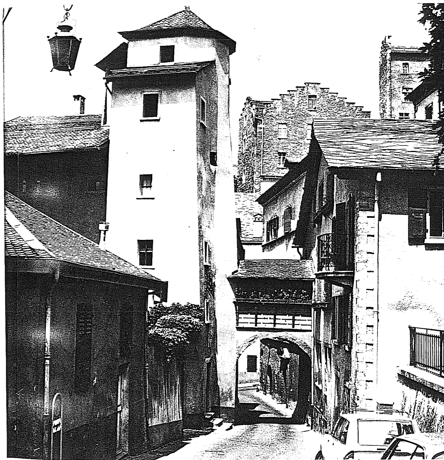
17. «La petite Lombardie», la città vecchia di Sion

vescovo Jost di Silenen (1482-1496), discendente da un casato urano e dunque per niente amico di Milano, l'episodio di San Marco cadeva opportuno per ripulire con le armi la frontiera meridionale. Pertanto, il vescovo non riuscì ad assicurarsi l'aiuto dei confederati, e dapprima anche le centene si opposero ai piani di Silenen. Ciononostante, il risoluto vescovo mandò, il 25 ottobre 1484, suo fratello, il capitano Albin, con 2000 uomini — di cui la maggior parte erano mercenari — oltre frontiera presso Gondo, e infatti questo esercito arrivò fino a Crévola d'Ossola senza incontrare resistenza, occupando punti strategici importanti. Il 6 novembre intervenne un'ambasciata confederata ed operò un armistizio. Un tribunale confederato, a Zurigo, per arrivare ad una decisione attese dal novembre 1484 fino al gennaio 1486 e sentenziò infine, sotto l'influsso del sindaco Waldmann — comprato con oro in tal senso — a favore di Milano, togliendo ai vallesani il successo. Questo scorretto