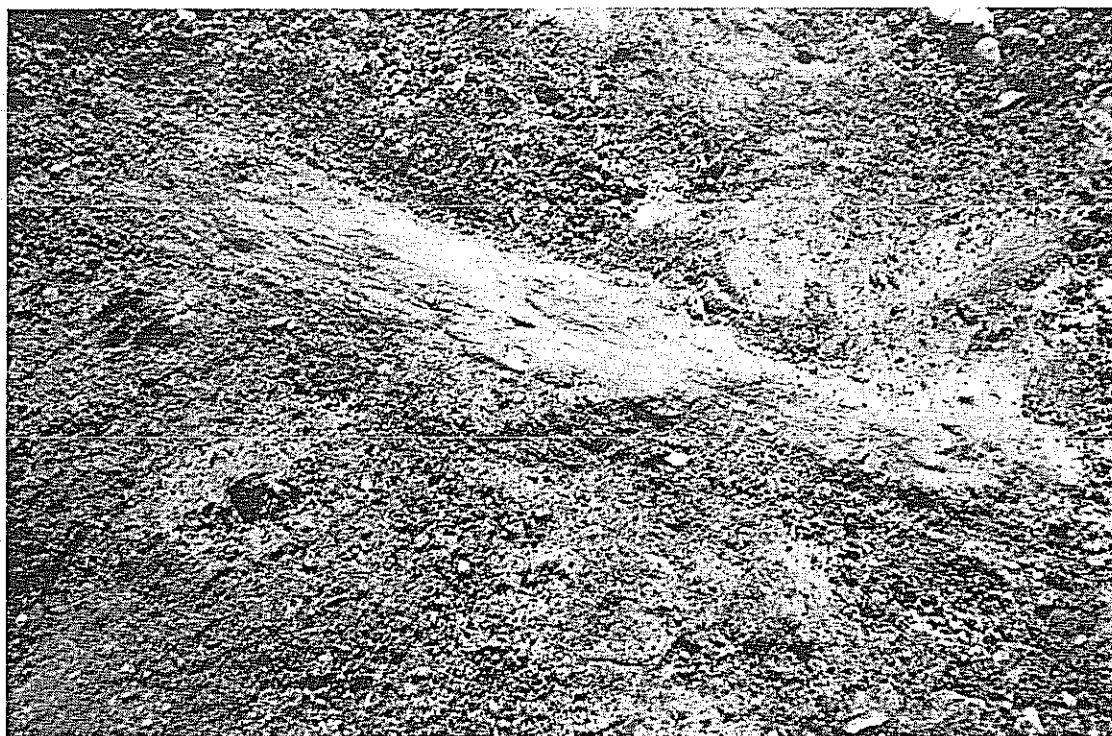
Isolino del lago di Varese: Palo orizzontale affiorato sulla riva.