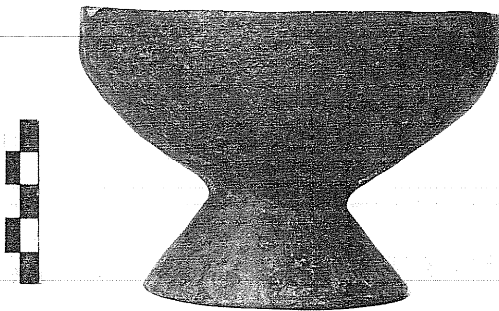
Sesto Calende: tipica coppa golasecchiana