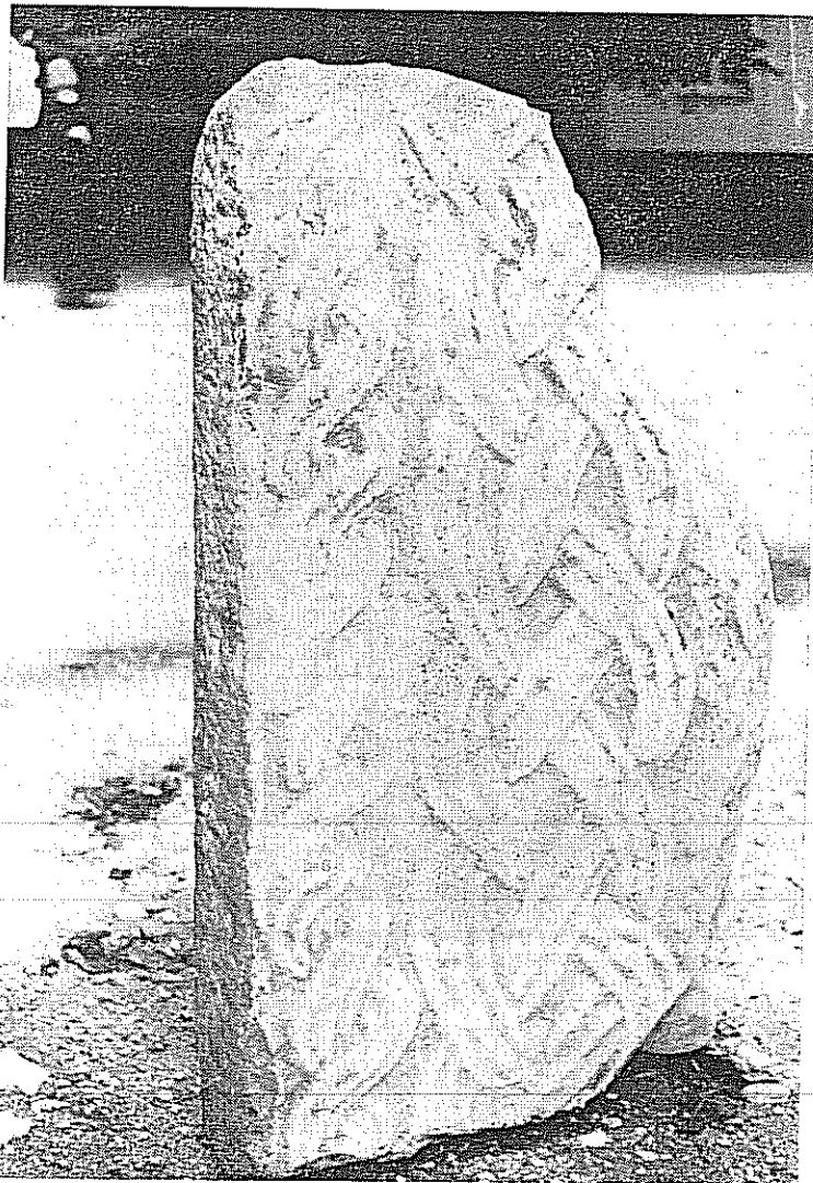
Travedona: Frammento di ambone marmoreo medioevale.