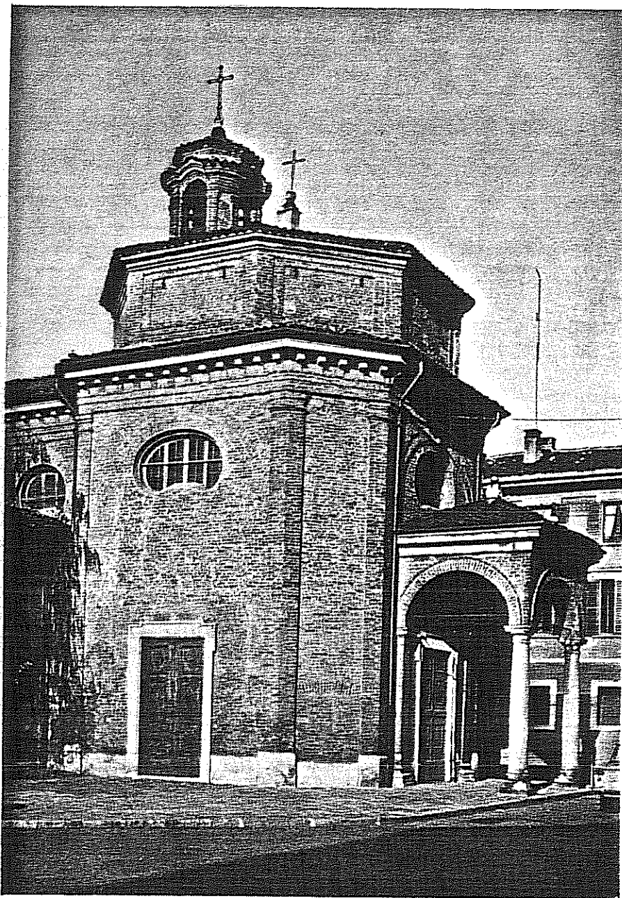
SANT'ANNA Tempio civico