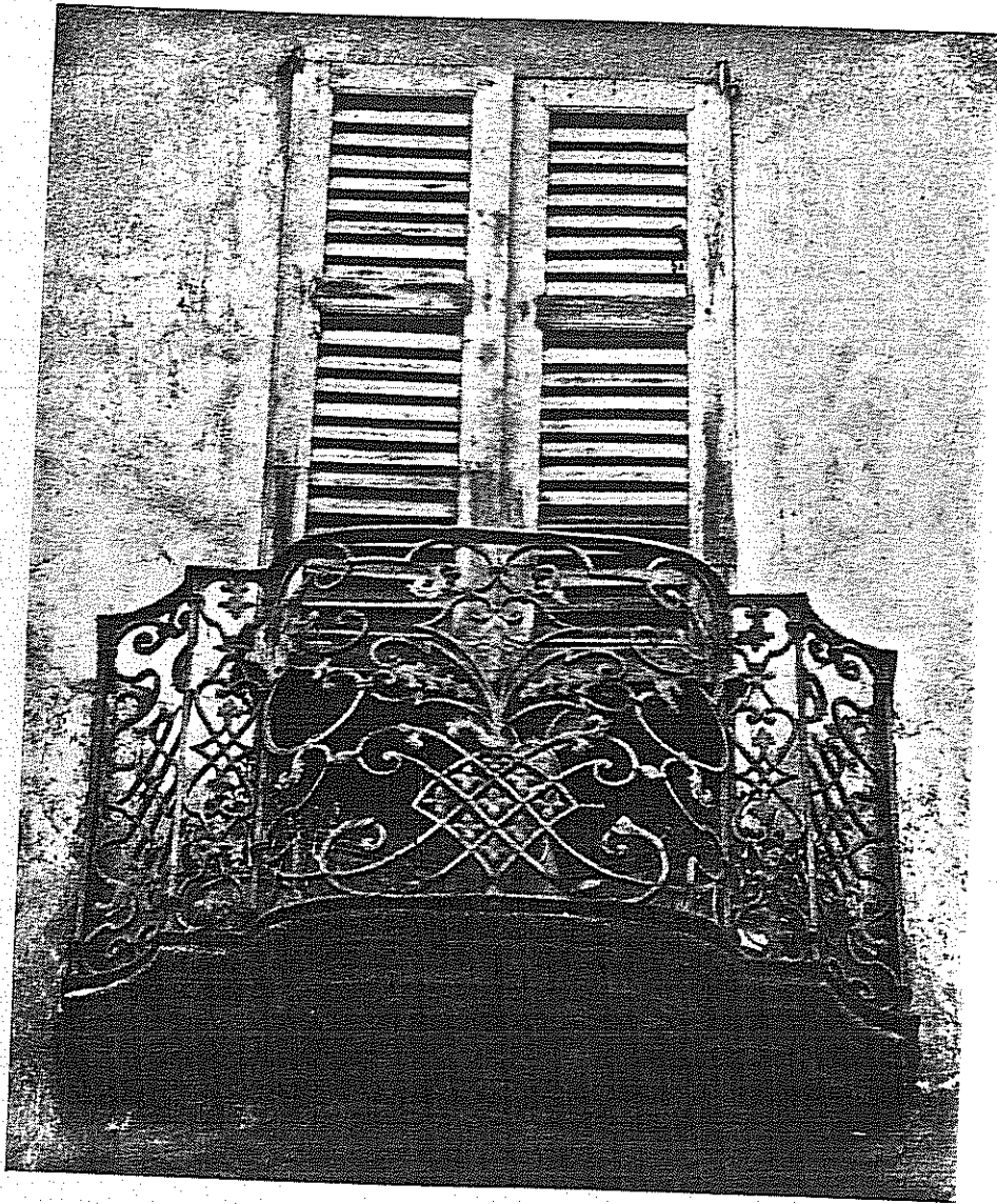
BALCONE IN FERRO BATTUTO