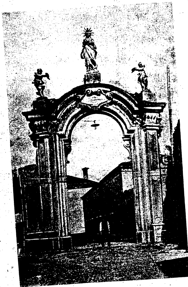
Arco d'ingresso al Monastero di Cairate.