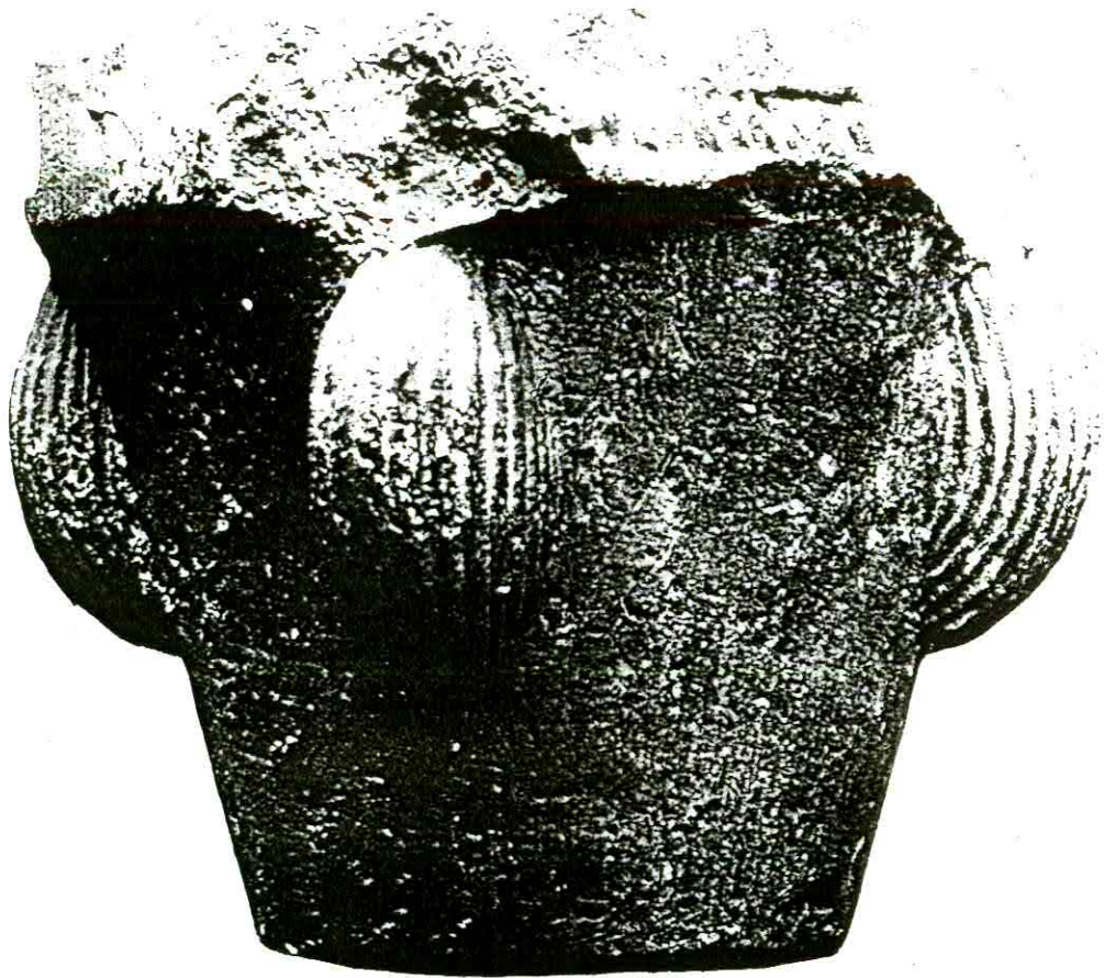
Fig. 8 Capitello , XII sec.