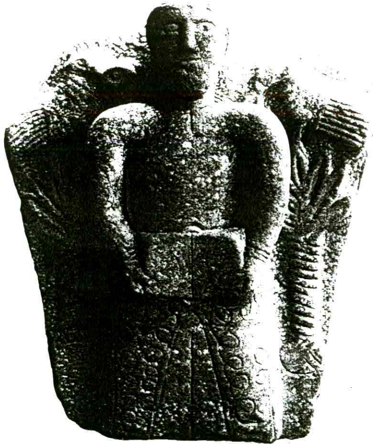
Fig. 10 Frammento scultoreo , fine XII sec. Pietra di calcare saccaroide, cm 46 x 25 x (?) Collocazione: Incino, Chiesa di Sant'Eufemia.