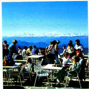
Albergo-Ristorante Vetta 1592 m s.m.