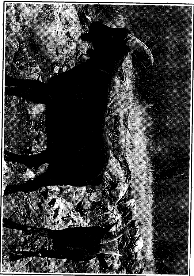
Una stupenda gita fuori porta: Civate