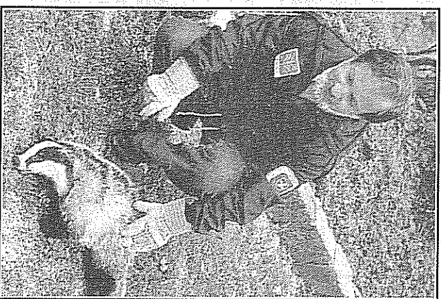
Qui sopra, una Guardia Ecologica Volontaria con un mammifero trovato nelle valli del Luinese (foto tratta dal volume «I mammiferi del Luinese», copertina sotto). In alto, veduta del Palace Hotel di Varese, edificio simbolo della Belle Epoque cittadina, con le sue

E che dire poi dei fratelli di Velate, detti Macio, Micio e Cacio? Più famoso era il Macio, che al mattino vendeva fiori campestri e cestini di legno e che al pomeriggio, dopo le inevitabili bevute di barbera, intratteneva i passanti al suono dell'armonica a bocca e al canto di ritornelli non sempre castigati. Se ci fate caso, ancora oggi il Sacro Monte offre di questi genuini e popolari personaggi pronti a passare nel gran libro della