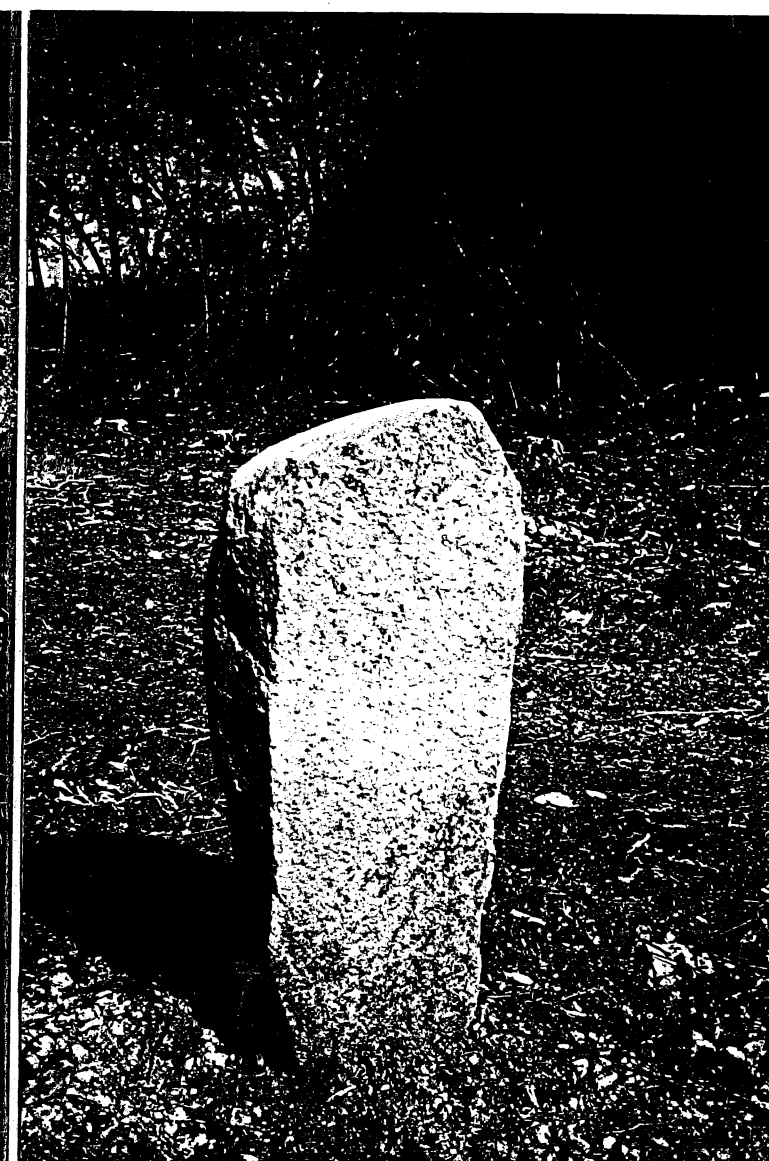
(FOTO 3) STRANO SASSO SOMIGLIANTE A UNA STELE GIACENTE SUL TERMINALE DELLA VIA SABOTINO E PROBABILMENTE UTILIZZATO DA ANTICHI CONTADINI COME TER- MINE DI PROPRIETÀ, IN UNA ZONA BOSCHIVA A OVEST DEL PAESE DET- TA DEI "GAHAGI" TOPONIMO ARIAMNICO TIPICAMENTE "LONGOBARDO" (SIRONI)