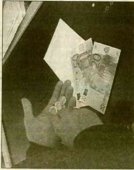
Anche il cambi dell'euro solletica la malavita

FAGNANO OLONA - Attenzione ai truffatori. Girano nelle case con qualsiasi scusa, si dichiarano funzionari degli enti più accreditati quali Enel, gas, persino il Comune o la parrocchia pur di "scroccare" soldi ai poveri pensionati, alle persone sole soprattutto anziane. In questi giorni hanno un altro spunto formidabile per imbrogliare la gente e arrotondare il botino del loro malaffare: cambiare le lire in euro, ovviamente inesistenti per non dire falsi. Attenzione, non date soldi a nessuno, non firmate nulla, non credete agli imbroglioni.