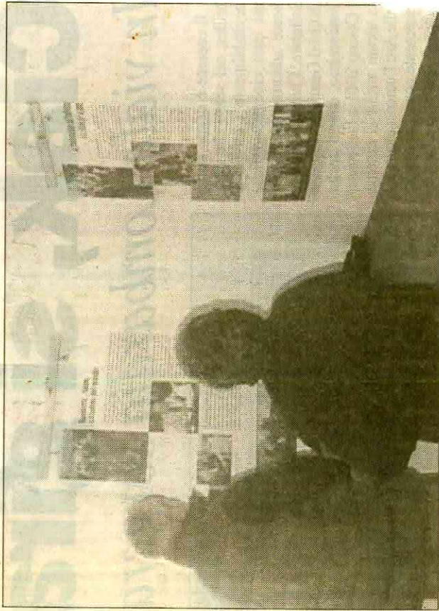
Alcuni pannelli della mostra fotografica "Costruttori di pace" allestita al Castello

Il giapponese Daisaku Ikeda e Daisaku. Scolaresche visitano la rassegna