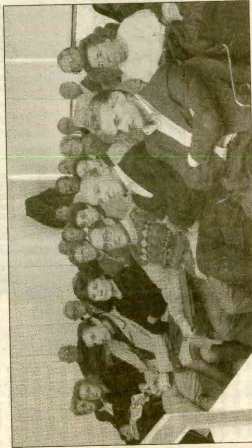
Il fotto pubblico presente alla prima lezione dell'Università della terza età