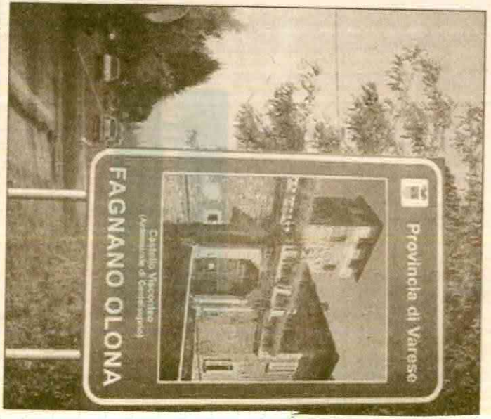
Il poster della Provincia con il Castello visconteo

Anche la Regione dà una mano a Fagnano inserendolo negli itinerari romantici in Lombardia appena edito. Il secondo dei quattordici itinerari raccolti nel fascicolo intitolato "Per sempre insieme" parla proprio di Fagnano e lo indica come tappa del percorso che partendo da Busto Incazza Gallarate, poi Fagnano, quindi Varese, Induno, Valganna Cuggiate Fabiasco. Ebbene, nessun altro paese della Valle è citato. Un bell'onore per Fagnano. Con una curiosità singolare. Il tour regionale consiglia di visitare Villa Bossi. Peccato che il complesso di via Verdi non sia aperto al pubblico. Chissà che la "provocazione" regionale non induca a prevedere la possibilità di aprire alle visite questo reperto romantico fagnanese.