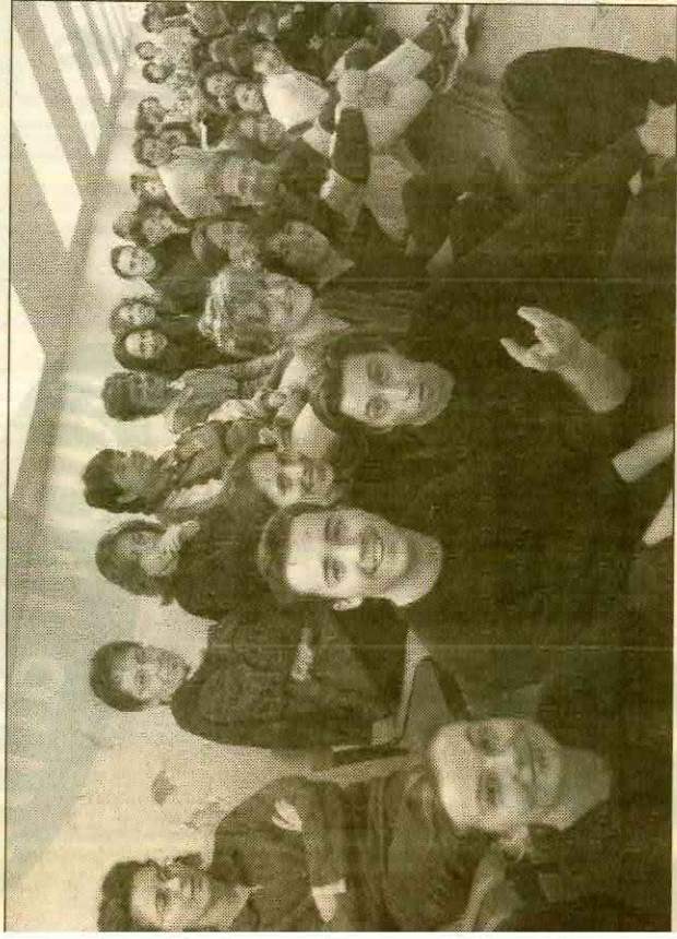
Gli studenti che hanno partecipato all'ultimo anno scolastico del Crt fagnanese

ggio dei gesti, animazione di gruppi e arti visive