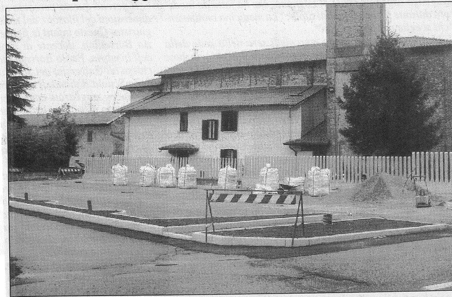
Il nuovo parcheggio realizzato accanto al santuario Madonna della Selva