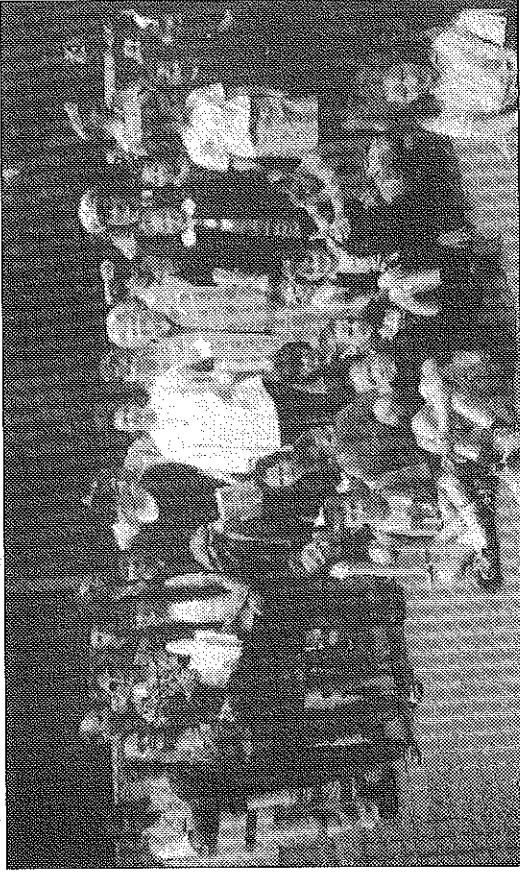
Ragazzi, insegnanti e istruttori al termine del corso sull'educazione stradale

Il programma è partito ieri sera con il film "Una storia vera". Le proiezioni si tengono all'aperto, nell'anfiteatro delle scuole elementari di via Pasubio. Biglietto singolo lire 8.000, abbonamento lire 24.000. Giovedì prossimo verrà proposto il film "Al di là della vita", seguirà "Kiripu e la strega Karaba" il 29 giugno, "Man on the moon" il 6 luglio.