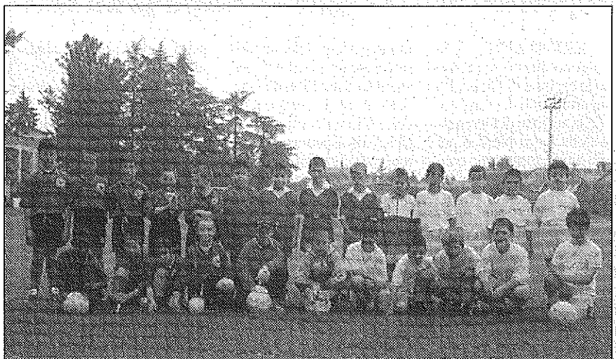
Quattro coraggiose scuole di calcio hanno sfidato la pioggia

Le sedici formazioni varesine sono attese domenica sul campo comunale. Sperando che il tempo faccia il bravo.