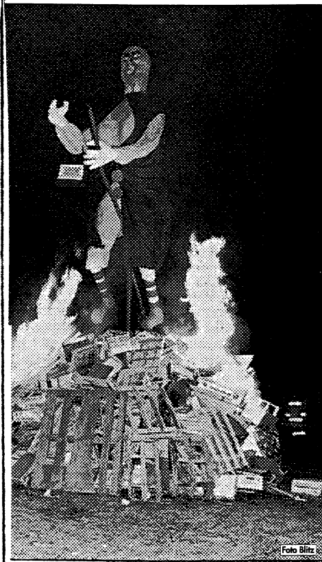
Il falò della Giubbiana.

E non è un caso. La Gioebiana è infatti una delle feste più tradizionali e antiche della nostra zona che ricorda il rito dei fuochi con i quali si scacciavano gli spiriti e si ringraziava l'arrivo della primavera.