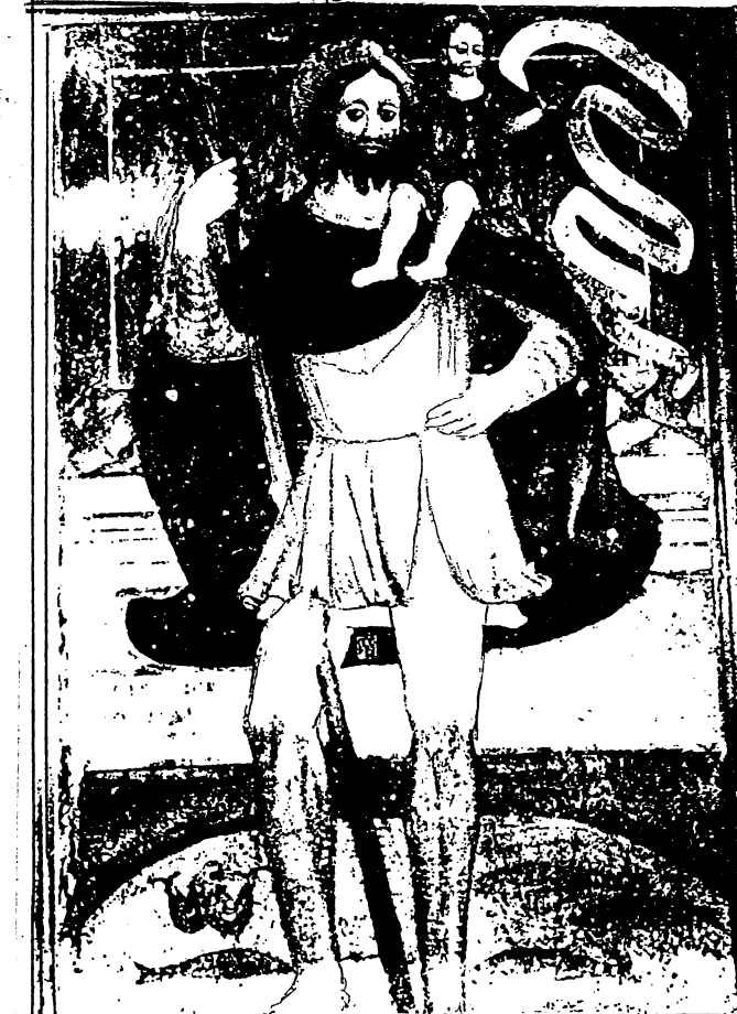
Madonna della Selva: Gli atteschi della navata. (S. CRISTOFORO)