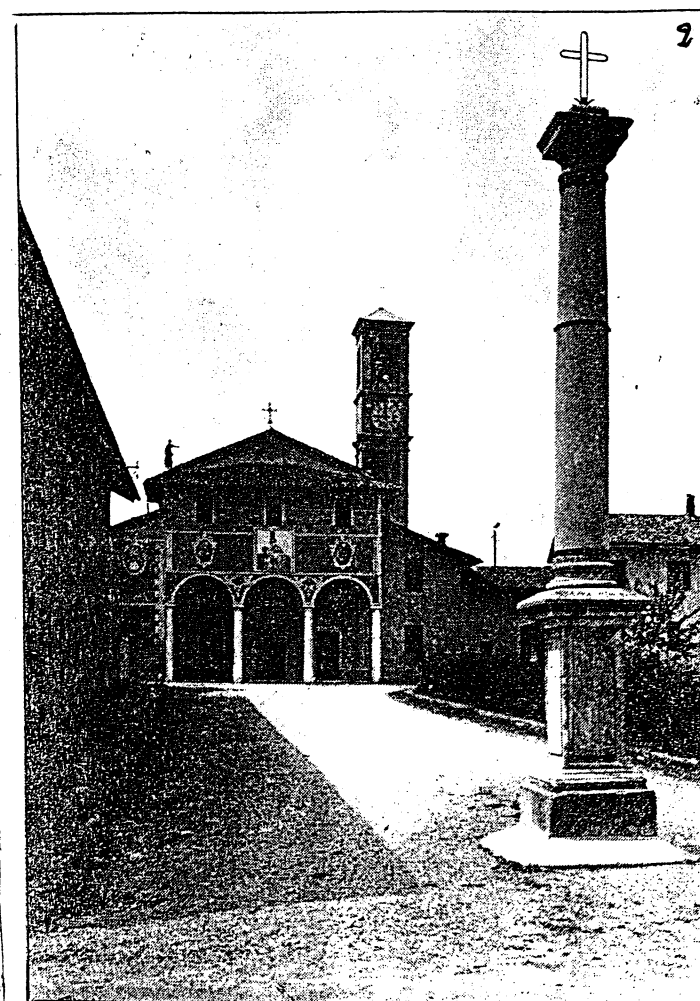
Madonna della Selva: Dopo i restauri del 1931