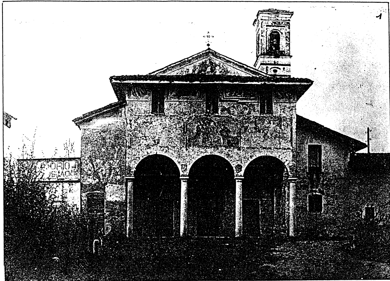
Madonna della Selva: Facciata prima dei restauri del 1931