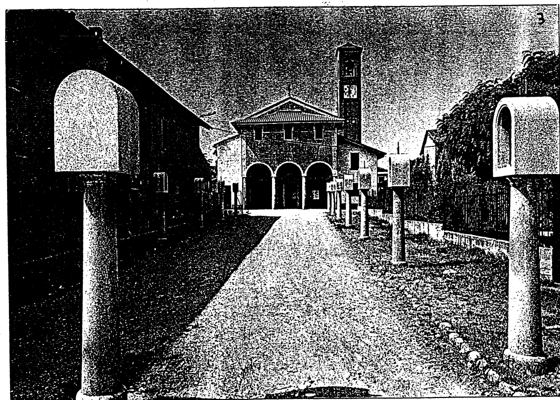
SANTUARIO DELLA MADONNA DELLA SELVA COME SI PRESENTA AI GIORNI NOSTRI.