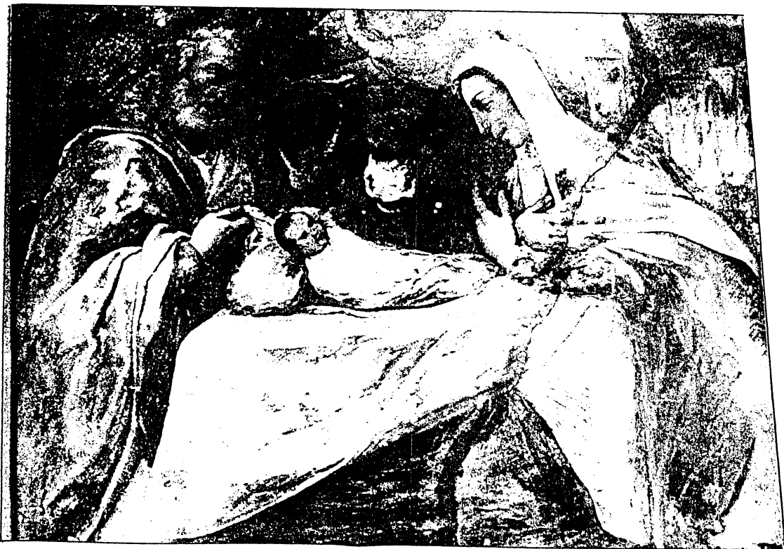
Madonna della Selva: Cappella del Rosario (particolare)

- Questo Santuario merita una visita di ammirazione e di preghiera, perchè si prolunghi nel tempo una tradizione di fede "Mariana" che ha radici profonde nella gente della nostra Valle.