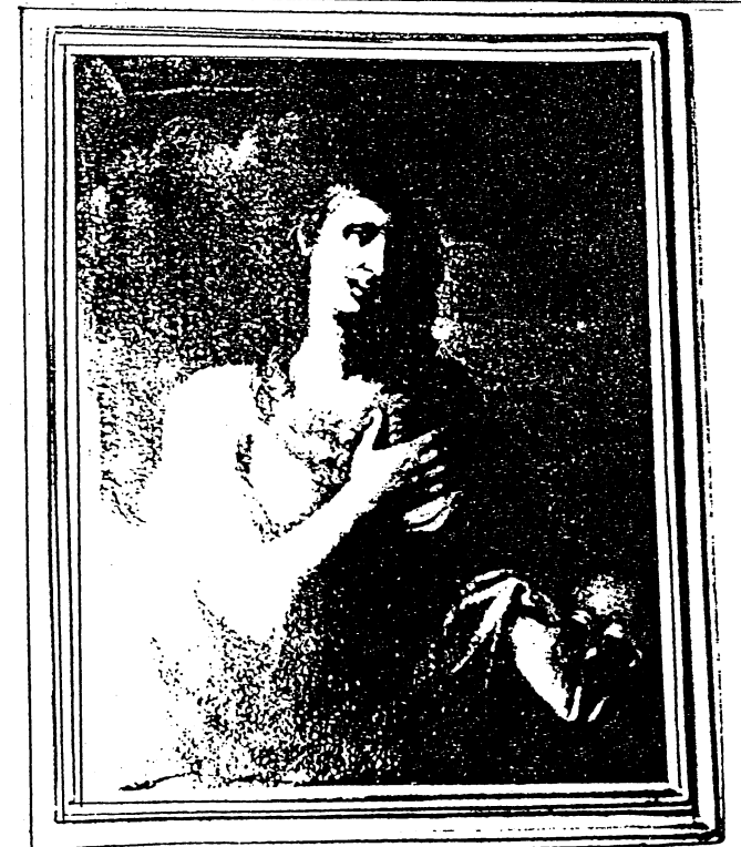
Cappella di Sant'Anna: S. Maria Egiziaca (o Santa Maria Maddalena)