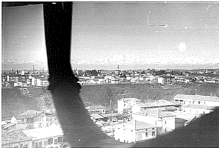
1965 idem (Nord-ovest)