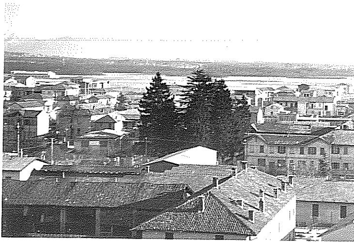
1966 PANORAMICA dal CAMPRNILE (Nord est) (L'abitazione del Palazzo Municipale e i monti a Nord est)