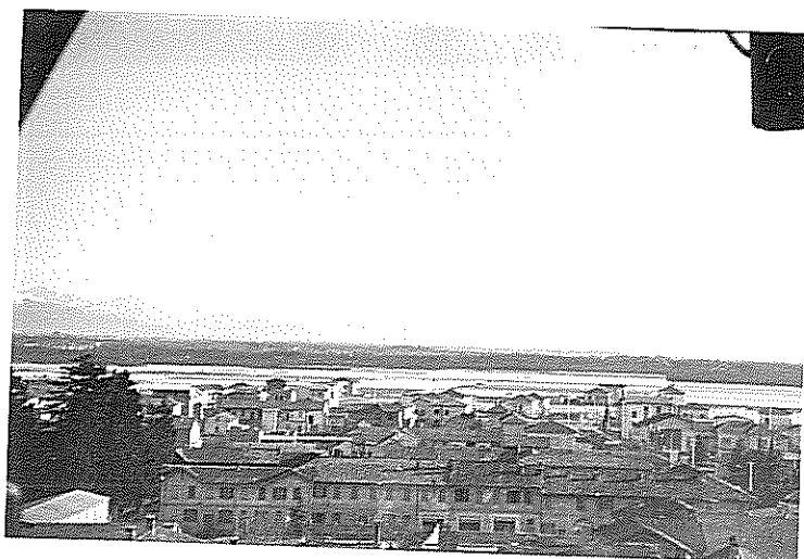
1966 idem (Est) (in primo piano le porte centrale della v. - marzini)