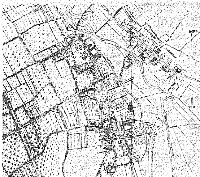
I due antichi nuclei del « borgo di Legnano » da una planimetria del 1850.

BERNARDINO CORIO - Il Corio, autore della storia di Milano, abitò in casa Melzi a Legnanello di fronte all'attuale chiesa di Santa Rita annessa al convitto dell'istituto « Barbara Melzi » sul lato sinistro di corso Sempione. La casa, ormai è ridotta in cattivo stato; vi si può ammirare soltanto un ampio cortile con colonnato cinquecentesco, mentre sono stati ormai cancellati completamente dalle intemperie e dall'incuria, affreschi e dipinti ornamentali dei secoli XV e XVI. Si ritiene che Bernardino Corio avesse qui una rudimentale tipografia artigiana per proprio uso dove stampò le prime copie della sua storia.