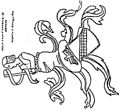
Fig. 30 — L'insegna del proprietario Lampugnani.

STEMMA con IMPRESA di LAMPUGNANI del 1500 circa Lampugnani Impres. di Lampugnani