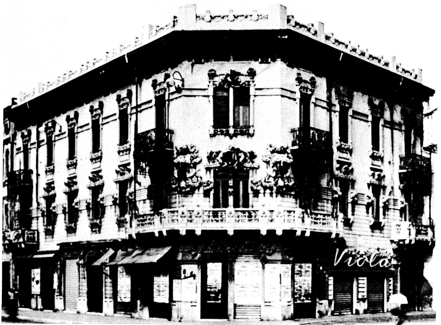
- Casa Rena, 1906-1907 - (demolita)