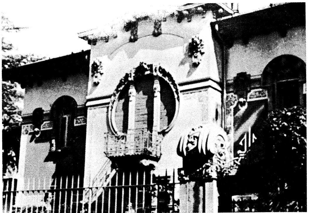
- Villa Ferrario, 1903-1907 .