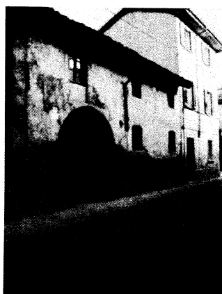
- Casa Rasini -