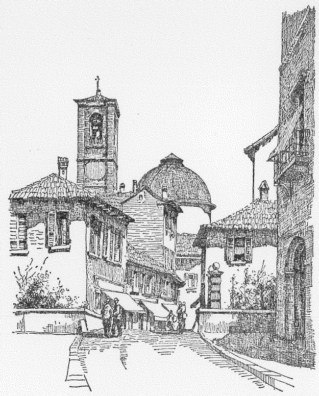
VECCHIA GALLARATE Contrada del Broda

GALLARATE Contrada del Broda CASTELLANZA Arco dei Platani 1764