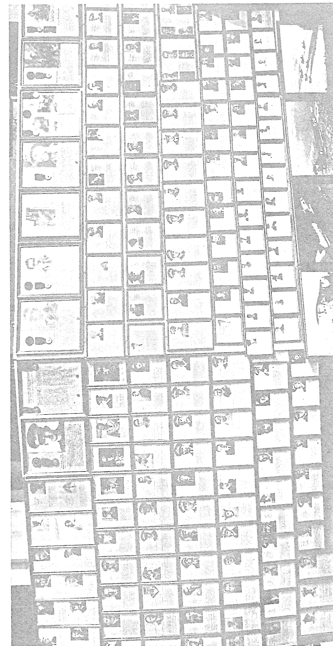
134 - Decorati di medaglia d'oro al v.m. dell'Esercito, Marina ed Aeronautica (in via di completamento) con fotografia e motivazione.