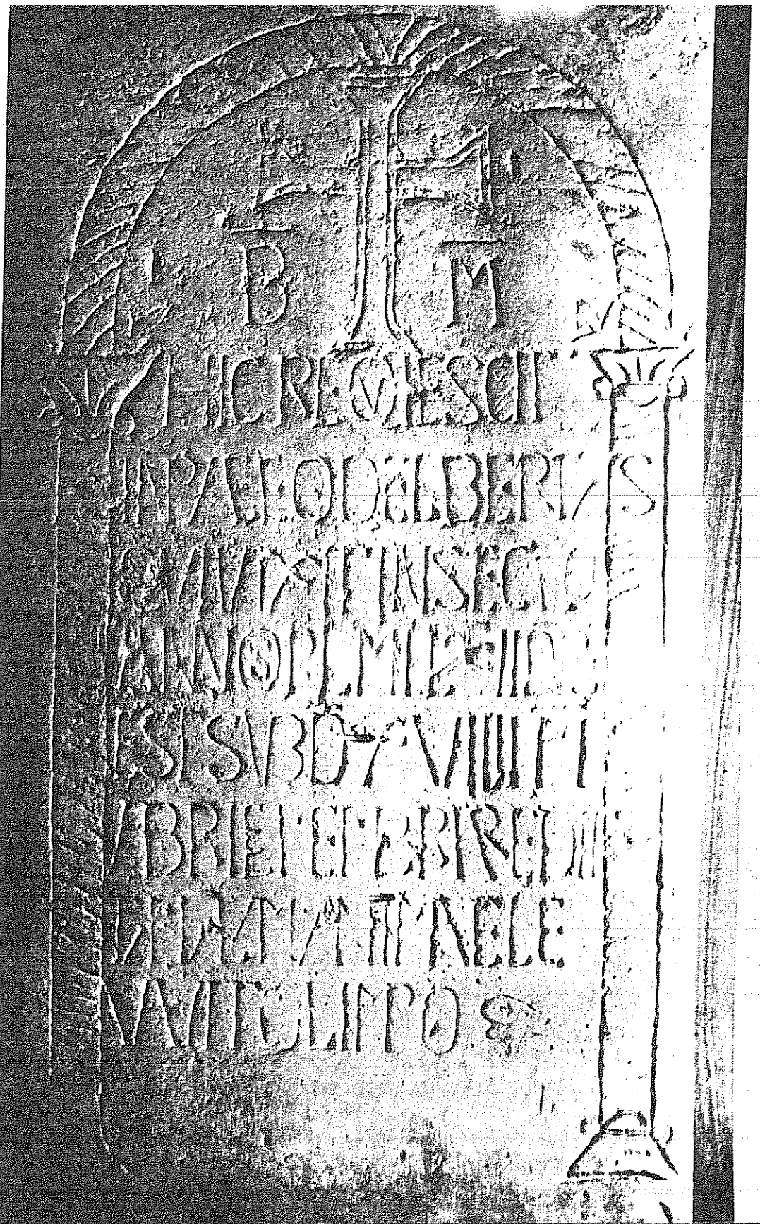
Fig. 3: Lastra Tombale di Ortoberto da Galliano Milano, Civiltà Museo del Castello Sforzesco.