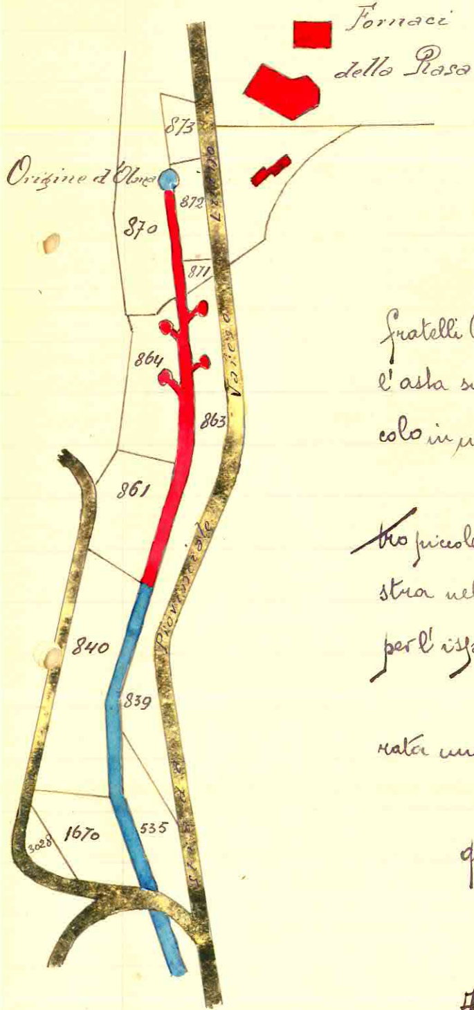
In rosso la bratta d'Olona combinata per M. 150.-

Fontem fluvii Olonae qui subter hume cuniculum manat et palude exceptum florante humo convertitur Albinus Amedeus Cagnola frater anno d'icis MC M XIX