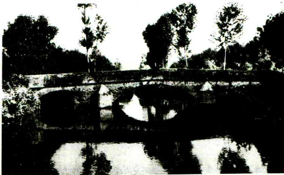
Fig. 13 Lardirago - Il ponte sull'Olona