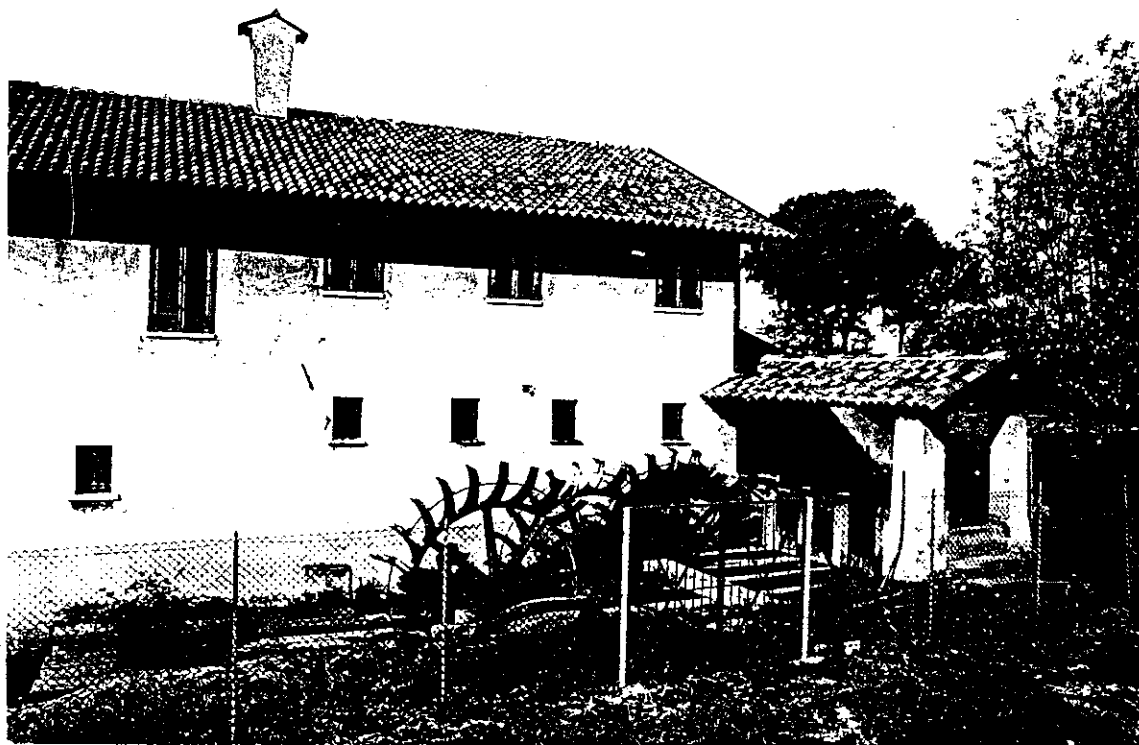
L'edificio dalla parte della roggia molinara.

(Da notare il contrasto dell'impianto con gli intonaci, i coppi e i serramenti nuovi).