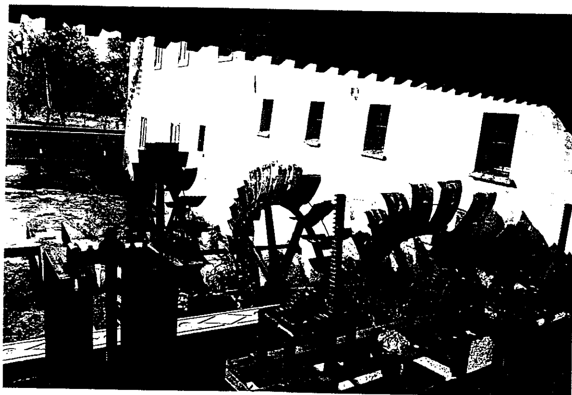
Particolare delle ruote e dei meccanismi per il sollevamento delle paratoie.