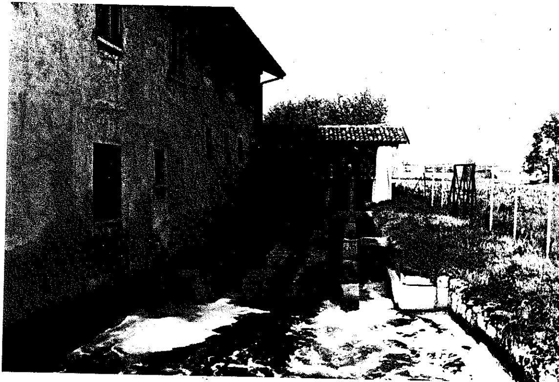
Il mulino Molaschi.