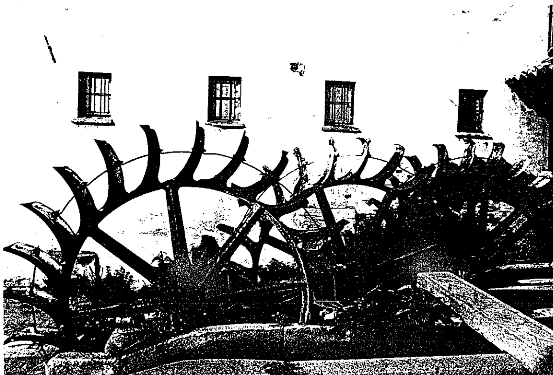
Le ruote tipo "Poncelet".

(Da notare il contrasto dell'impianto con gli intonaci, i coppi e i serramenti nuovi).