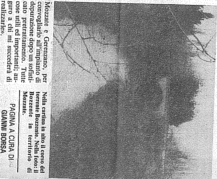
Nella cartina in alto il corso del torrente Bozzente. Nella foto: il Bozzente in territorio di Mozzate. PAGINA A CURA DI GIANNI BORSA

«Abbiamo incaricato la ditta Segit di realizzare un impianto per l'abbattimento del fosforo; per questo è arrivato un finanziamento regionale di 224 milioni. Il migliore investimento previsto è però quello del raddoppio della linea di depurazione per l'impianto di Origgio. Occorrerebbero anche alcune 'vasche-volano' per regolare il flusso dell'acqua ed evitare allagamenti periodici; dovrebbero essere realizzate a Gerenzano, Uboldo ed Origgio. Si è anche pensato ad un collettore che raccogli il percolato delle discariche di