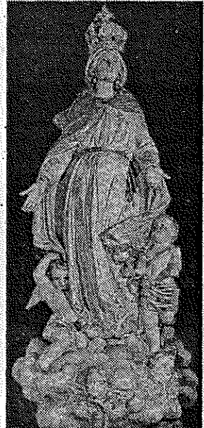
Alcuni volontari stanno ultimando i preparativi della festa. A lato l'Assunta