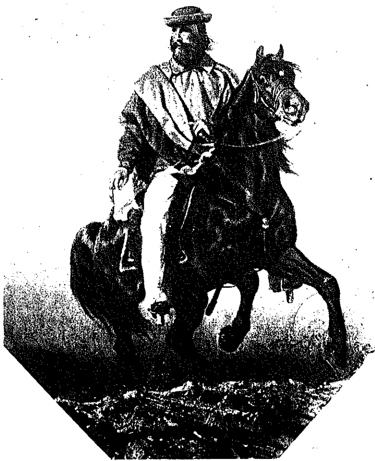
Ritratto di Caribaldi, di Filippo Palizzi, eseguito nel 1861: e dai napoletani donato all'Eroe.

(Già in possesso di Paolo Preda, dei Mille)