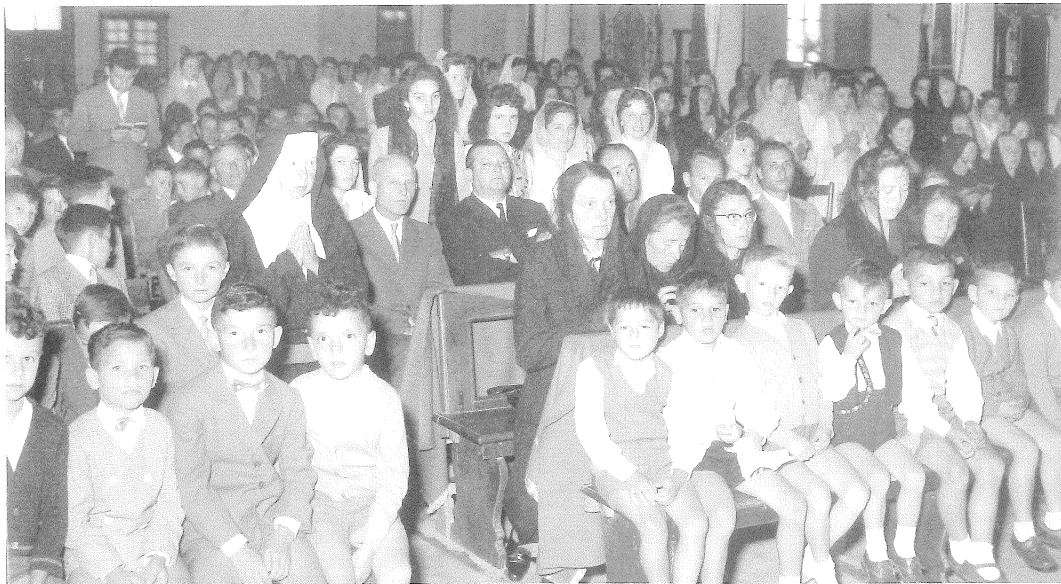
Una solenne festività vede riunita molta gente: donne, uomini e bimbi pregano bene ma un po' assiepati. Le panche e le sedie nuove arriveranno nell'anno 1959.