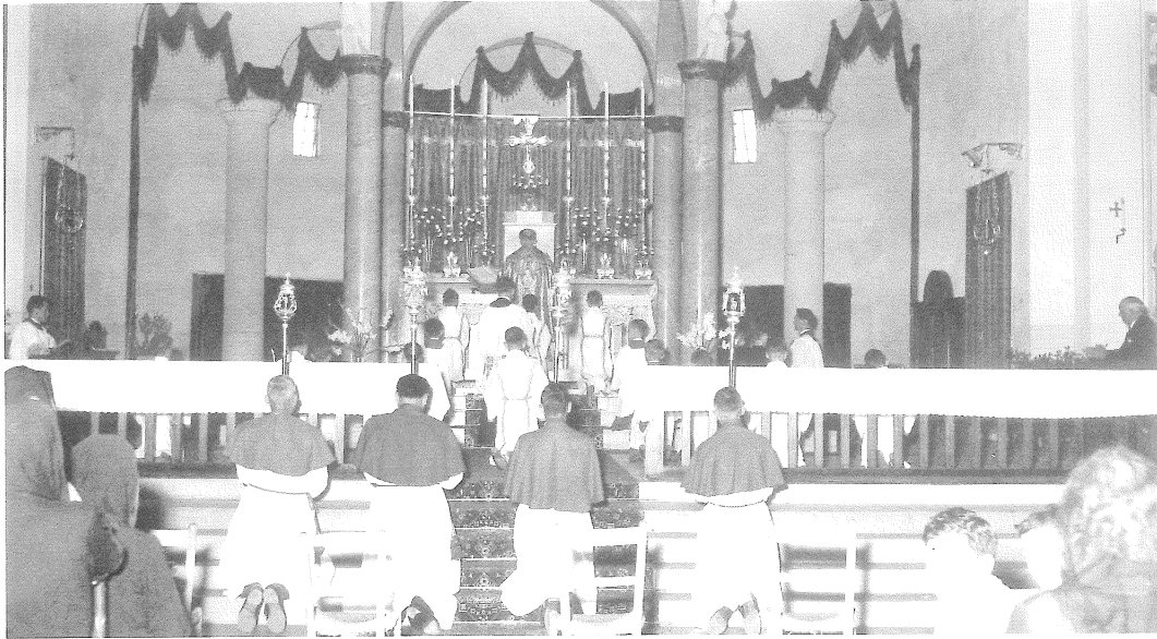
Il 4 dicembre 1954 fu celebrata la prima S. Messa sul nuovo altare che venne consacrato il 24 luglio 1955 da sua Eminenza il Cardinale Giovanni Battista Montini.