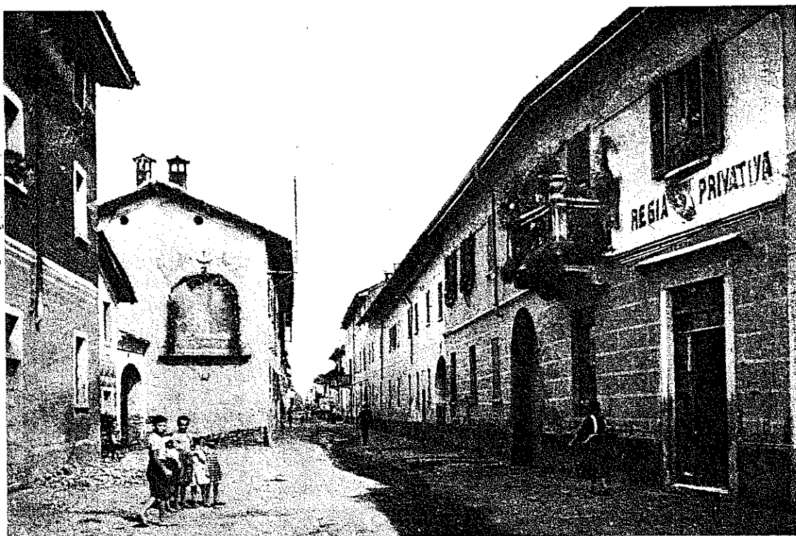
93. Corso Vittorio Veneto com'era negli Anni Trenta. La strada era in parte a selciato e in parte in terra battuta con pendenza verso il centro dove si raccoglieva l'acqua piovana, che scorreva come un torrentello, da nord a sud. Il grande affresco della Pietà sulla casa di fronte (buon lavoro attribuito a un Ferdinando Villa di Vigevano) è stato sconsideratamente distrutto. La tabaccheria è tuttora nello stesso stabile di destra. Nella casa di sinistra ebbe stanza la Guardia Regia durante il Regno Lombardo-Veneto.