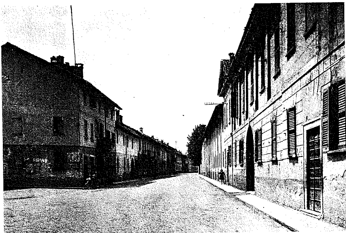
94. L'antica via Bezzerà (via Armando Diaz dopo la prima guerra mondiale) con la piazza della pesa in primo piano negli Anni Venti. La tradizione orale ricorda che l'antico selciato di questa via e delle altre due che la intersecano nella piazza fu fatto con l'aiuto del Vicerè e della nobiltà milanese al tempo di Francesco Giuseppe d'Austria.