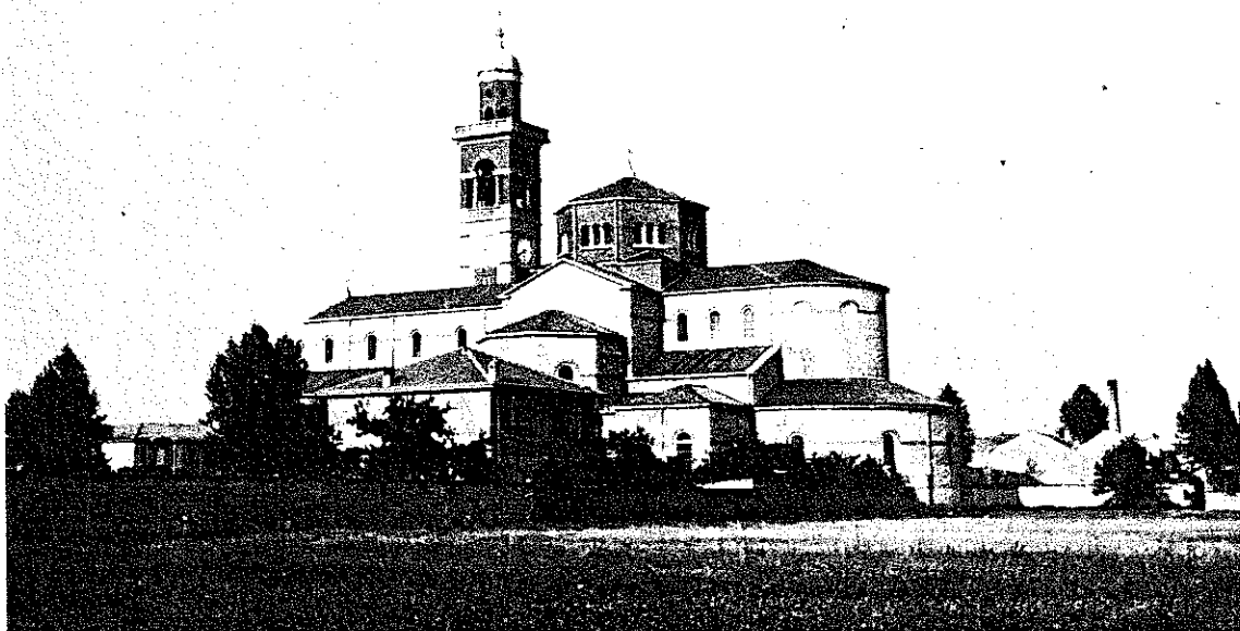
92. La nuova chiesa parrocchiale di Bienate vista dal lato ovest. La cartolina-foto è di dopo gli Anni Cinquanta. Di fianco alla chiesa si nota la casa parrocchiale, ultimata nel 1947. In primo piano il campo dell'oratorio maschile, costruito nel 1952. In fondo i capannoni e la ciminiera della Tessitura Angelo Scampini.