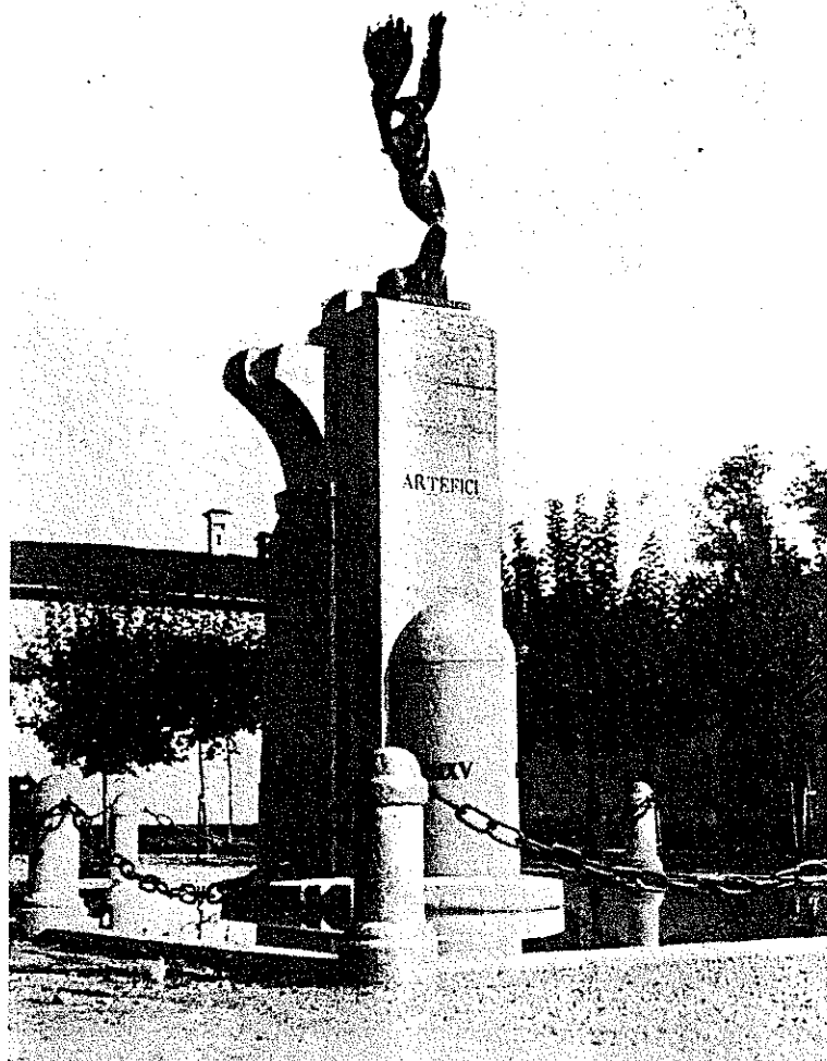
90. Monumento ai caduti di tutte le guerre. Opera dello scultore Arrigo Minerbi.