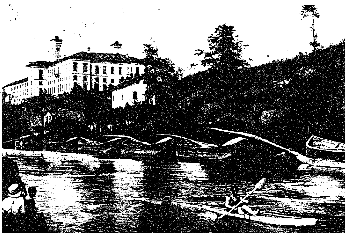
86. Ancora una immagine del Naviglio Grande dei pressi del palazzo Clerici. In primo piano un solitario canoista.