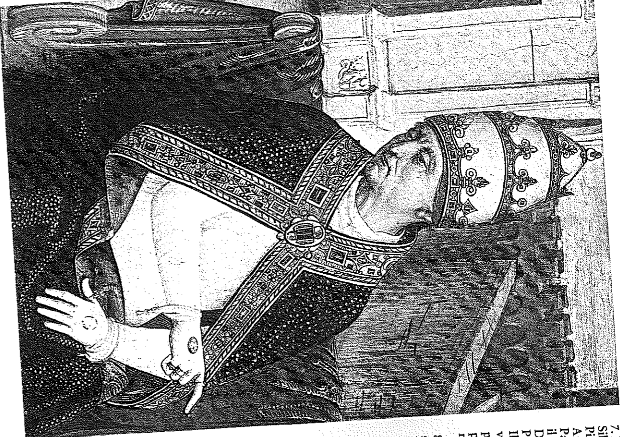
7. Pinturicchio, Enea Silvio Piccolomini, papa Pio II, giunge ad Ancona.

Il prete Pietro copriva l'ufficio di cimiliarca, ossia il custode del tesoro della chiesa, in parole più semplici, amministrava i beni posseduti dal S. Lorenzo. Mentre una carta del 997 presenta i quattro sacerdoti usufruttuari di tali beni con l'obbligo dell'ufficiatura, un'altra del 1068 avverte che erano ordinati nella «vita comune», quella cioè che nell'816 ad Aquisgrana era stata stabilita per tutto il clero in cura d'anime, e che la riforma di Alessandro II (1061-1073) e di Gregorio VIII (1073-1085) avevano ripristinato: tale modo di vita assicurava una spiri-