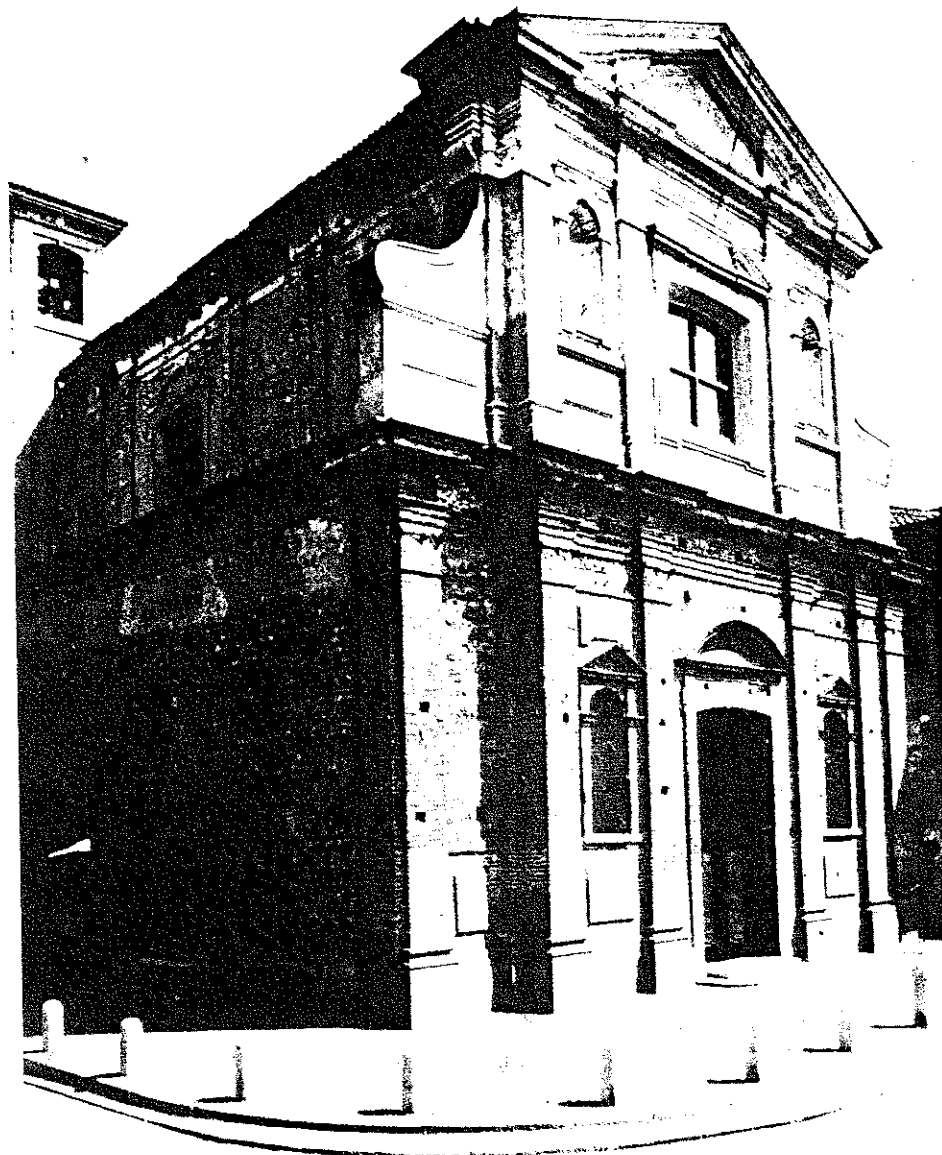
2. La chiesa dei SS. Cosma e Damiano dopo il restauro nel 1985.

studi giuridici. Da qui l'aggregazione al collegio cittadino dei giureconsulti (tradizionale ambito di promozione alla vita pubblica per l'élite della società milanese), il trasferimento presso la curia pontificia, gli incarichi svolti al servizio dell'amministrazione dello Stato della Chiesa, le missioni di rappresentanza per conto della Santa Sede, culminanti nella nunziatura in Spagna, sono le tappe obbligate che il Nostro seguì e attraverso le quali il "sistema" puntava all'educazione di un "principe della Chiesa". Oltre ad essere servo fedele del Vicario di Cristo, il cardinale doveva essere abile nel governo degli uomini, nella conduzione degli affari pubblici e, più in generale, nell'arte della "politica" ecclesiastica e secolare (5) .