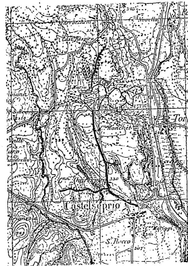
Le difese della Rocca, del Borgo e i fossati periferici di Castel Seprio nel XIII Secolo

Per tutta l'età romana e sino a quando in quella medievale se ne perse l'uso, vico fu infatti una qualifica non genericamente data a tutti gli insediamenti di campagna, bensì a quelli soli che, oltre un proprio esclusivo ambito territoriale ed una propria organizzazione interna, avessero potuto vantare per tradizione anche un'origine antichissima. Ciò che serve appunto a richiamare la nostra attenzione su Vico Seprio.