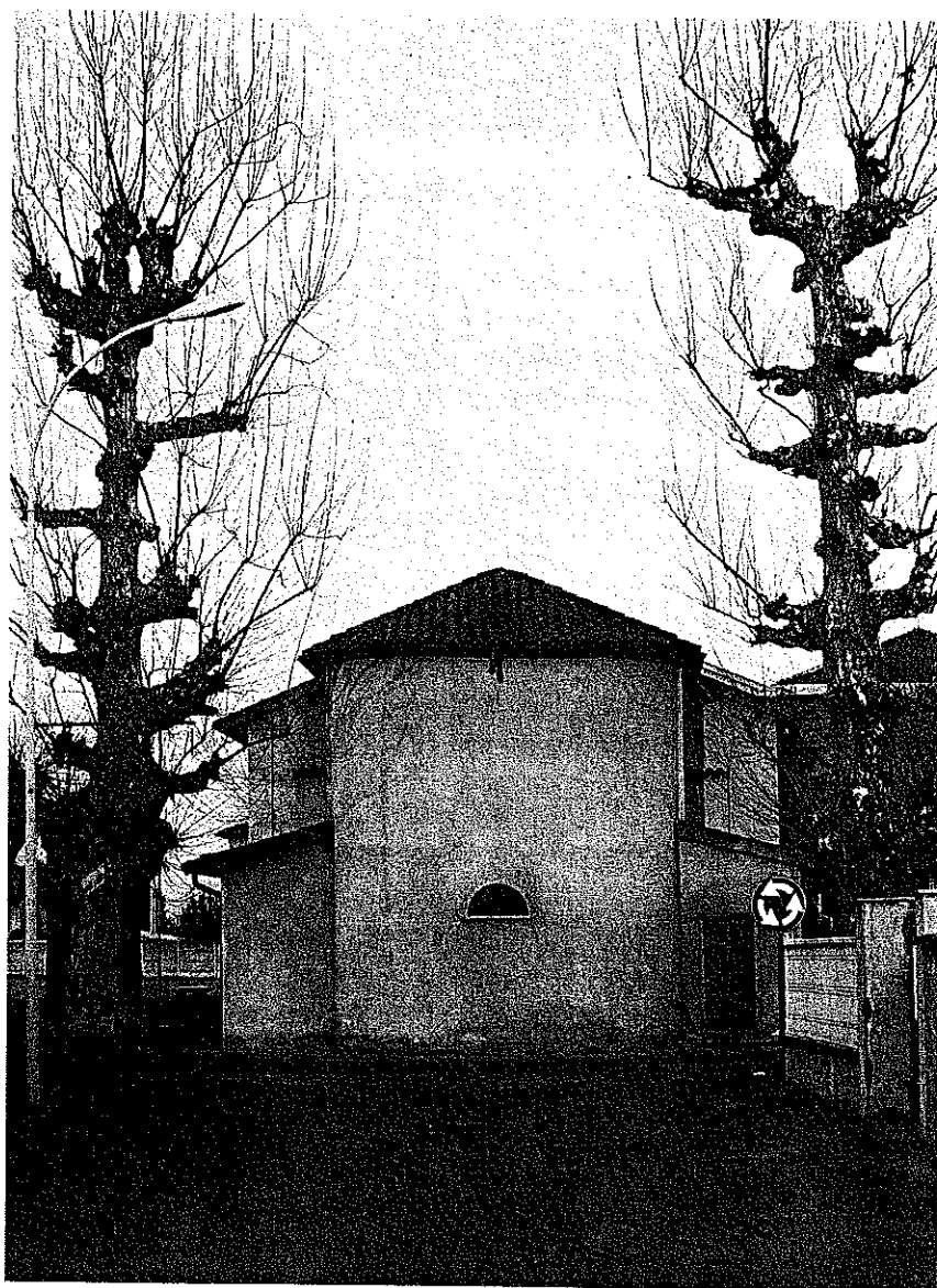
36. L'Abside della chiesa di San Salvatore dopo il restauro (1994).

Nella pagina successiva: 37. Fianco settentrionale della chiesa di San Salvatore dopo il restauro (1994).