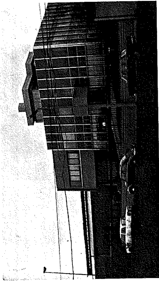
Sovico: i fondatori della Beta e la nuova sede degli uffici.